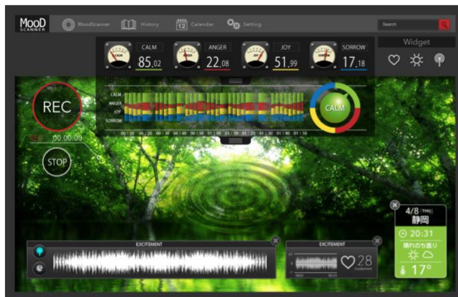
図表3 リアルタイム音声感情分析