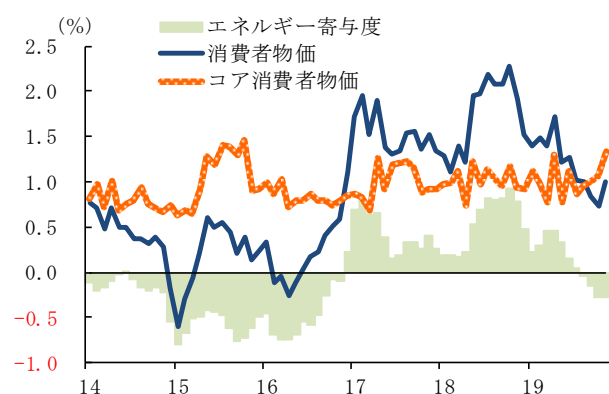
■ユーロ圏:消費者物価（前年比）

注:コア物価は食料・たばこ・アルコール・エネルギー除く