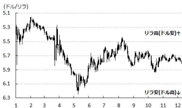
図3 リラ相場(対ドル)の推移