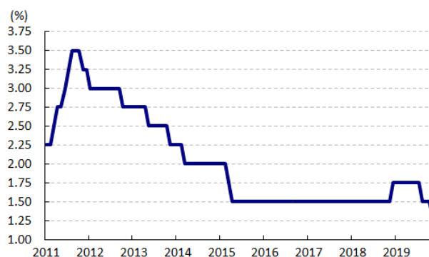
図3 政策金利の推移

こうしたなか、中銀は6日に開催した定例の金融政策委員会において政策金利を2会合ぶりに政策金利を25bp引き下げ、いわゆる『リーマン・ショック』をきっかけにした世界金融危機直後以来となる1.25%とする決定を行った。なお、8月の利下げ決定の際には、政策委員の票が『5（25bpの利下げ）対2（据え置き）』と割れる動きがみられたものの、今回も同様に『5対2』となるなど政策委員の間に依然として慎重姿勢がくすぶっているものと判断出来る。会合後に公表された声明文では、 「貿易摩擦に伴う世界貿易の萎縮を受けた財輸出の減少に加え、観光客数も緩やかな伸びに留まる結果、財政出動にも拘らず雇用・所得環境の悪化や家計債務負担の重石も重なり家計消費は減速が見込まれ、民間投資も見通しを下回るなど、経済成長率は直近の経済見通しを下回るペースに留まるとともに、潜在成長率を下回る水準となる」 など弱含んでいるとの見方を示した。なお、先行きについては「 米中摩擦に伴う生産拠点移管の動きやインフラ投資拡充の動きが下支えになる 」としつつ、「 国有企業による投資遅延の動きが公共投資の足かせになる 」との見方を示すとともに、「 貿易摩擦の激化や地政学リスクが下振れ要因となる 」一方、「 景気刺激策の効果発現の動向を注視する必要がある 」とその効果を期待する姿勢をみせた。一方、足下のインフレ率は同行が定めるインフレ