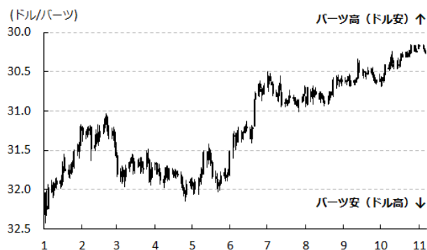
図2 バーツ相場(対ドル)の推移