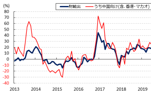
図1 財輸出額(前年比)の推移

景気を下支えする動きがみられる（詳細は9月4日付レポート「 豪州、景気拡大局面は「112四半期連続」と記録を更新したものの 」をご参照下さい）。その一方、同国ではここ数年、活発な資金流入を背景に不動産投資が活発化したものの、バブル化を警戒した当局の監督強化を受けて一昨年を境に不動産市況は調整局面に転じており、家計債務はGDP比119.4%（今年3月末時点）と主要国のなかで突