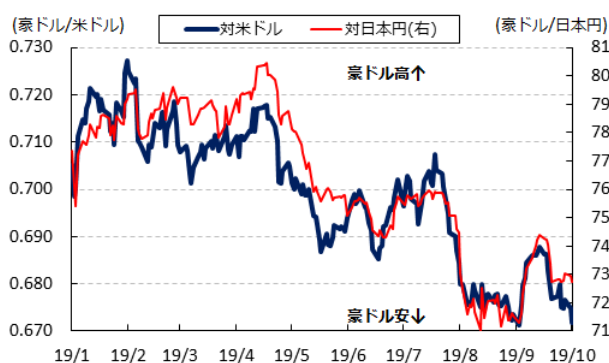
図4 豪ドル相場(対米ドル、日本円)の推移