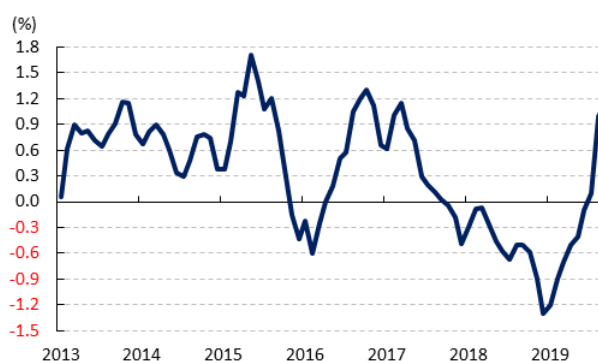
図2 コアロジック住宅価格指数(前月比)の推移

こうしたなか、中銀は1日に開催した定例の金融政策委員会において、政策金利であるオフィシャル・キャッシュ・レート（OCR）を3会合ぶりに25bp引き下げて過去最低水準となる0.75%とする決定を行った。会合後に公表された声明文では、海外経済について引き続き「 リスクは下方に傾いているものの、見通しは妥当 」とする見方を据え置いたほか、国際金融市場について「 世界経済の下振れリスクや世界的な低インフレに伴い、世界的に低金利環境が続き、さらなる金融緩和が期待される 」としつつ、豪ドル相場について「 近年で最も低い水準にある 」と豪ドル安の進展を好意的に捉えている。一方、同国経済について「 年前半の景気は見通しから下振れした 」ものの、足下では「 緩やかな転換点に達した模様 」とした上で、先行きについて「 低金利環境や減税策、現在進行中のインフラ投資、一部に安定化の兆しがみられる不動産市場、底堅い鉱業セクターを巡る見通しが下支え要因になる 」との方向性は据え置かれた。ただし、「 家計部門における可処分所得の上昇が緩やかなものに留まることが家計消費の重石となる状況は変わっていない 」とするなど、家計消費の動向が内需の不透明要因になるとの見方を据え置いている。なお、過去数回の定例会合で最も注視する材料としてきた雇用環境については「 雇用拡大が続き、労働参加率も歴史的な高水準で推移している 」と引き続き評価する一方、「 先行指標には雇用の伸びが頭打ちする可能性を示唆している 」との見方を示した。その上で、「 賃金の伸びは足