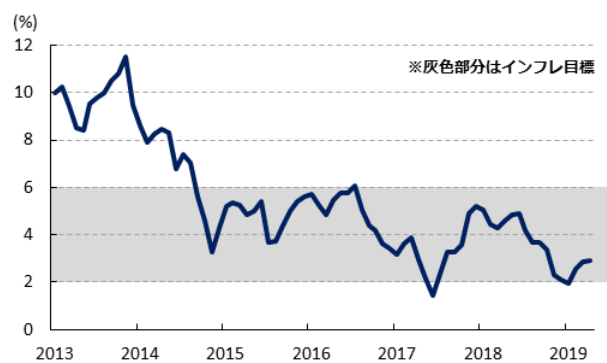
図3 インフレ率の推移

ただし、先月末に発表された2018-19年度の経済成長率は前年比+6.8%と5年ぶりに7%を下回る伸びに留まったほか、1-3月に限れば実質GDP成長率が前年同期比+5.8%と4年強ぶりに6%を下回るなど景気減速が鮮明になっていることが確認された（詳細は3日付レポート「 インド・モディ政権は船出早々「荒波」に直面 」をご参照下さい）。モディ政権は先月末に新たな閣僚人事を発表して2期目をスタートさせており、金融市場においては改選前から与党BJP及び与党連合（NDA：国民民主連合）が議席を積み増したことを受けて『モディノミクス』が巻き直されるとの期待が高まり、主要株価指数（ムンバイSENSEX）は最高値圏で推移しているほか、通貨ルピー相場も底堅く推移している。モディ政権は任期に当たる向こう5年で経済成長の再加速を実現することを目指しており、当面は選挙公約で示された巨額のインフラ投資の実現などを通じて景気のでこ入れを図るとの見方が強まっている。他方、昨年末にモディ政権及び与党BJPとの意見対