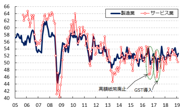
図1 日経製造業・サービス業 PMI の推移

ここ数年のインド経済を巡っては、2014年の政権交代によって発足したモディ政権の下での経済政策である『モディノミクス』を通じて構造改革が進むとともに、経済成長が加速するとの期待が高まった。モディノミクスの成果としては、2016年末に行われた高額紙幣廃止措置、2017年のGST（財・サービス税）導入に伴う税制改革などが挙げられる一方、政策実施に伴う事前準備の稚拙さなどに伴い同国経済は幅広く混乱状態に陥る事態もみられるなど功罪相半ばするところとなった。企業マインドの動きをみると、一連のイベントに伴い一時的に急速に悪化する動きはみられたものの、その後は比較的早く回復するなど悪影響を克服している様子うかがえる。しかし、モディ政権発足以降の企業マインドは製造業、サービス業ともに堅調な動きをみせているものの、シン前政権の頃に比べて全般的に勢いに乏