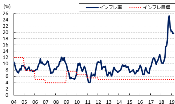
図2 インフレ率とインフレ目標の推移

先月末以降の金融市場においては、上述の通り中銀は先月末に1週間物レポ取引を「当面」中止する方針を発表し、その後も事実上の『緩い資本規制』などを通じてリラ安圧力の封じ込めを継続させるなど流動性の乏しい状態が続いている。他方、中銀が定める主要政策金利は1週間物レポ金利であるが、再開後も取引量は以前に比べて小規模となるなかで25日に行われる定例の金融政策ではどういった対応を示すかに注目が集まった。なお、会合では1週間物レポ金利を5会合連続で24.00%に据え置く決定を行ったほか、翌日物貸出金利及び翌日物借入金利もそれぞれ25.50%、22.50%に据え置かれるなど、政策内容についてはまったく変更がなされなかった。また、会合後に発表された声明文についても、足下の同国経済に対する現状認識及び先行きの見通しなどは3月の前回会合からほぼ変わっていないものの、先行きの政策運営について昨年6月以降一貫して示してきた「 必要であれば、さらなる金融引き締めを実施する 」との文言を削除するなど、これまでに比べて『ハト派』姿勢が強まった印象となった。昨夏以降のいわゆる『トルコ・ショック』に伴うリラ安を受けて上振れしたインフレ率は、昨年10月に前年同月比+25.24%と15年ぶりの高水準に達し、その後は頭打ちの様相をみせているが、足下では早くも底打ちしており、中銀が定めるインフレ目標（5%）の実現にはほど遠い状況が続いている。さらに、上述の米トランプ政権による対イラン制裁強化の方針決定を受け