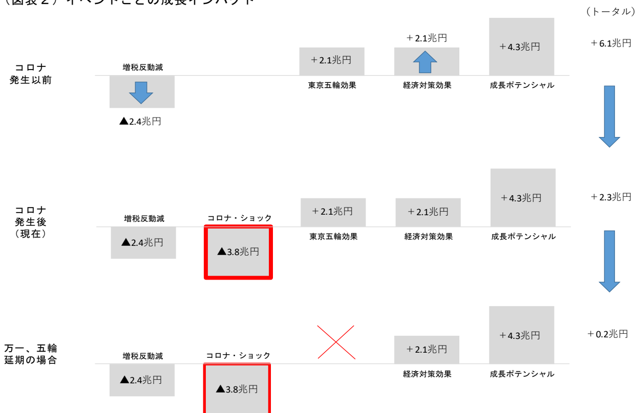
（図表2）イベントごとの成長インパクト

以前、新型コロナの影響がなかった段階では、（1）増税のダメージを（3）と（4）で相殺する