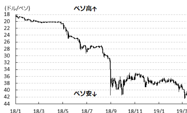
図1 ペソ相場(対ドル)の推移

売り（米ドル買い）の為替介入に動かざるを得ない事態となる一方、IMFとの合意では1営業日当たりの介入額の上限が5000万ドルと設定されるなど厳しい条件が課されるなかで難しい対応に迫られた。先月には1営業日当たりの介入額の上限を7500万ドルに引き上げるなど条件を緩和したものの、それ