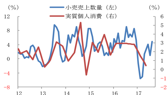
■英国の小売売上数量と実質個人消費

注：小売売上数量は3ヶ月移動平均、3ヶ月前対比年率 個人消費は前期比年率 出所：英統計局