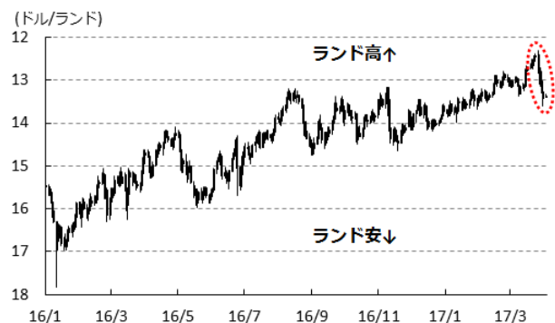
図1 ランド相場(対ドル)の推移