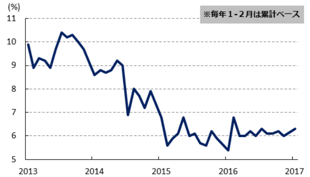
図3 鉱工業生産(前年比)の推移