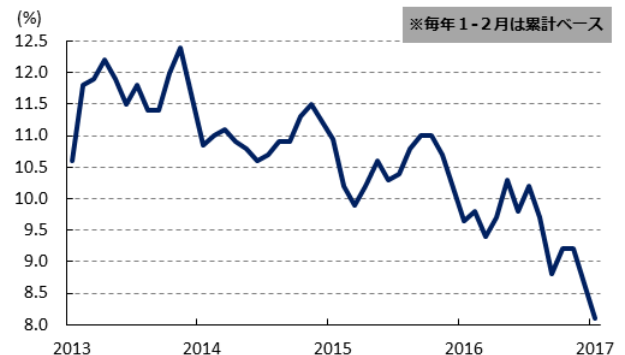
図1 小売売上高(前年比/実質ベース)の推移

大きく下押ししたことが影響したと考えられる。それ以外にも服飾関連や化粧品のほか、日用品関連で消費が鈍化する動きがみられる一方、不動産取引が活発化していることも追い風に家具や建築資材関連で底入れが進んでいるほか、これまで低迷が続いてきた宝飾品などの高額消費にも底打ち感が出ており、自動車の代替需要として高額消費が動いている可能性は考えられる。また、月次の動きをみると1月は前月比+0.51%と昨年12月（同+0.78%）から伸びが大きく鈍化するなど個人消費に下押し圧力が掛かったものの、2月には同+0.95%と前月の反動も重なり徐々に高い伸びとなるなど、今年は春節の時期が前倒しされたにも拘らず個人消費にとっては反ってプラスになっている様子がうかがえる。他方、自動車販売は小売売上全体の1割程度を占めることから、結果として減税措置は今年末まで延長されたものの上述の通り減税幅は圧縮されるなど、昨年のような押し上げ効果は期待しにくくなっていることを勘案すれば、個人消費が主導する形で経済成長を実現することのハードルは高まっている。さらに、現在開会中の全人代（全国人民代表大会）では、今年の経済政策の重要テーマの一つに「内需の潜在力向上（消費拡大）」が掲げられているものの、過去数年に比べて減税