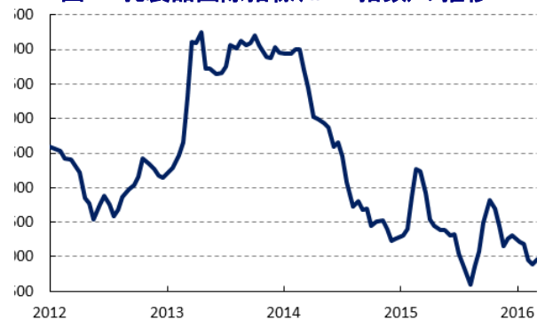
図1 乳製品国際指標(GDT 指数)の推移