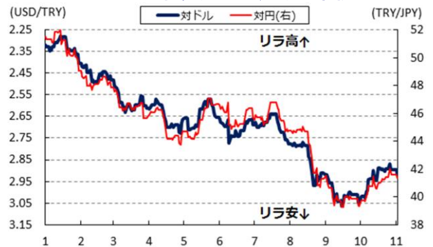
図1 リラ相場(対ドル,円)の推移

シリアにおけるISILの活動が依然活発ななか、同国ではシリアからの難民が大量に流入していることで新たな課題が生まれていることに加え、上述のように政情不安も懸念される状況に陥ったことで、多くの国民のなかで政治的安定を求める声が強まったことが影響した可能性が考えられる。今年9月にシンガポールで実施された総選挙において、事前には野党の躍進が予想されていたものの、世界経済の不透明感が増すなかで政権運営に対する安心感を理由に与党人民行動党（PAP）が大きく得票率を向上させるに至ったのと同様の展開とも捉えられる。その意味においては、多くのトルコ国民にとっては「現実的な判断」を行う環境が整っていたと考えられる。その一方で同国の選挙制度においては得票率10%を下回る政党に対しては議席が配分されないが、6月の総選挙で大きく躍進した最大野党である共和人民党（CHP）の得票