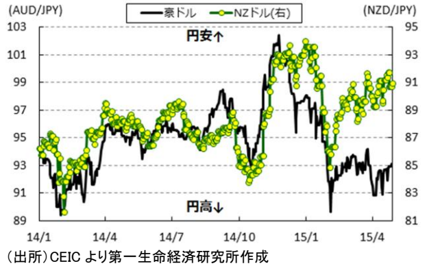
図4 豪ドル・NZドルの対円為替レートの推移

ろう。両国の経済規模を単純に比較すれば、米ドルベースで豪州はニュージーランドの 7.3 倍（2014 年）もの差があることに加え、経済構造をみても個人消費などの内需依存度は両国ともにほぼ同じであるものの、ニュージーランドの方が輸出依存度は高いために海外経済の動向に左右されやすい。足下の世界経済が中国をはじめとする新興国経済の云わば「バブル的」な経済成長に依存しにくくなっており、特に、中国経済の高成長が期待出来ない状況では外需主導による景気回復は見込みにくい。そうした点でも、中長期的にみてNZドルが豪ドルに対して強含み続ける可能性は低いものと予想される。なお、足下では豪ドルに対してNZドル相場が強含みする展開が続いているため、日本円に対しても両通貨の強弱が歴然と現れる動きがみられるものの、先行きについては米国の利上げを背景に米ドル高圧力が高まることが予想される。その際には、上述のように足下で相対的に強いNZドルにより強い逆風が吹く可能性があり、結果的に対円為替レートについても調整圧力が強まる展開も予想される。そうした観点では、今後は米国の金融政策の正常化という一大イベントを控えるなかでオセアニア通貨にとっては厳しい状況が待ち受ける可能性に留意しておく必要性は高まっていると判断出来よう。