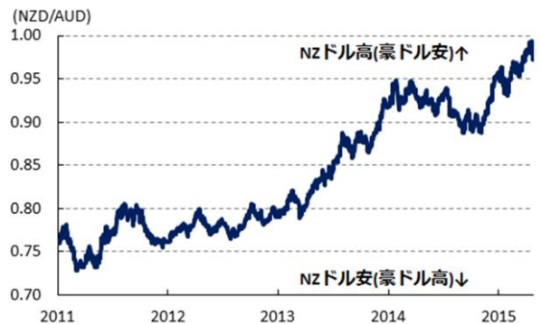
図1 豪ドル・NZドル相場の推移