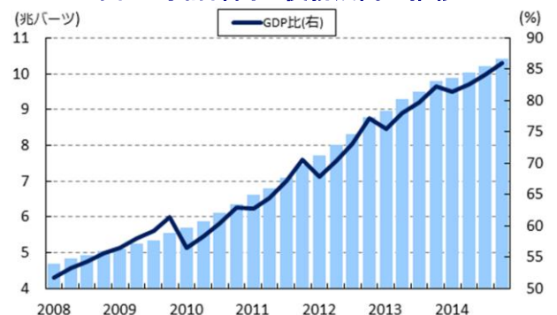
図1 家計部門の債務残高の推移