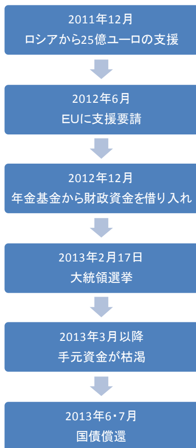
(図表1) キプロス支援関連の主要日程

日に、既に投機的な水準にあった同国の外債建て長期債格付けをCCC+に、ムーディーズは1月10日にCa a 3に格下げし、デフォルト相当格付けへの転落が真近に迫っている。