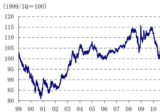
■ユーロの実効為替レート