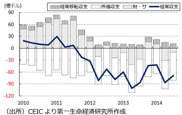
図4 経常収支の推移

なお、インフレ昂進は景気に悪影響を与える懸念はあるが、経常赤字の縮小が見込まれるほか、低所得者層を対象とする社会支援によりその影響は緩和されるとし、補助金削減によって生じた余剰資金を生産性の高い経済活動を促すべく配分することで持続可能な経済成長に繋がるとの見方を示す。その上で、来年の経済成長率については5.4～5.8%になるとの従来の見方を据え置いた。当研究所も短期的には物価上昇による個人消費などへの悪影響が懸念されることで景気に下押し圧力が掛かる状況は避けられないものの、来年以降はその影響が緩和されること、政府による改革姿勢の前進を受けて海外資金の回帰なども見込まれることから、経済成長率は加速感を強めるものと予想する。