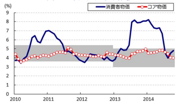
図 2 インフレ率の推移

本資料は情報提供を目的として作成されたものであり、投資勧誘を目的としたものではありません。作成時点で、第一生命経済研究所経済調査部が信ずるに足ると判断した情報に基づき作成していますが、その正確性、完全性に対する責任は負いません。見直しは予告なく変更されることがあります。また、記載された内容は、第一生命ないしはその関連会社の投資方針と常に整合的であるとは限りません。