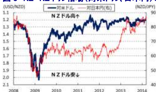
図3 NZ NZドル相場(対米ドル、日本円)の推移