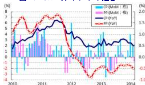
図 15 CN インフレ率の推移