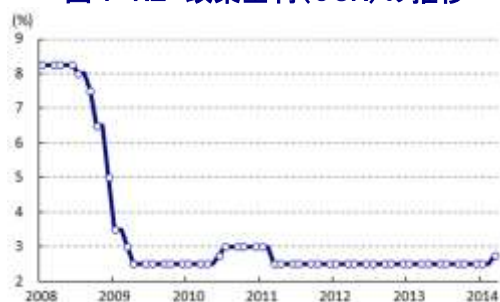
図1 NZ 政策金利(OCR)の推移

ることも利上げ決定を後押しした。他方、NZドル高は輸出競争力の低下を招いており、足下の水準は長期的に持続可能な水準ではないとの見方を示している。さらに、昨年10月から実施された不動産融資規制の効果が徐々に始まっており、今後は利上げも不動産価格の上昇抑制に繋がると見込まれるが、移民拡大はその効果を相殺する展開が続くとみている。こうしたことから、足下のインフレ率は依然低水準に留まるものの、先行きについてはインフレ圧力が強まる状況が避けられず、同行は利上げを決定したとの考えを示した。なお、今後の政策金利の行方については経済動向などを踏まえて判断するとしており、追加利上げの可能性については中立的な姿勢をみせている。