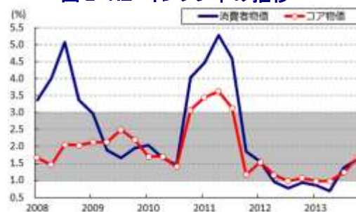
図2 NZ インフレ率の推移