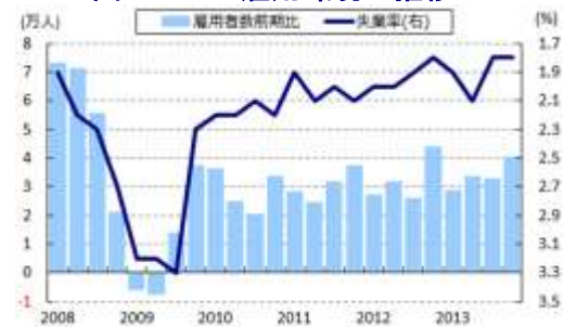
図 28 SG 雇用環境の推移