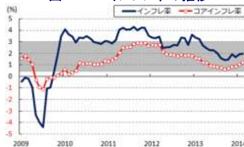
図6 TH インフレ率の推移