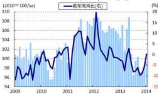
図 27 SG 小売売上高の推移

14日に発表された1月の小売売上高は前年同月比+0.1%となり、前月(同▲5.5%)から8ヶ月ぶりに前年を上回る伸びに転じた。前月比も+0.6%と前月(同+1.4%)に続いて拡大しており、堅調な雇用環境を背景に個人消費は底堅く推移していることが確認された。2月からの自動車所有権証書(COE)の分類変更に伴うCOE価格の上昇懸念を反映して、月ごとに売上が大きく変動する自動車売上が前月比+2.7%と前月(同+10.8%)に続いて拡大したことが影響した。一方、自動車を除いたベースでも前月比+0.2%と前月(同+0.0%)から底堅い動きもうかがえるほか、高額消費などにも底入れの動きが出ていることから、内需を巡る展開は比較的堅調な推移が見込まれる。