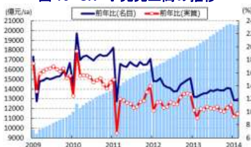
図 16 CN 小売売上高の推移