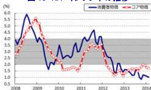
図13 KR インフレ率の推移