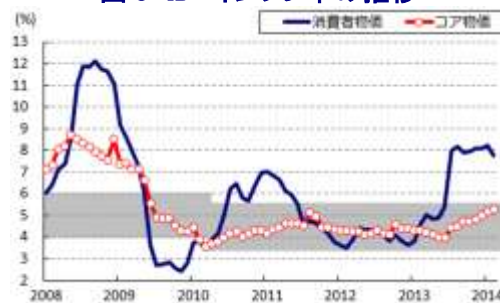
図8 ID インフレ率の推移