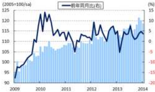
図 25 MY 鉱工業生産の推移