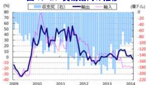
図19 IN 貿易動向の推移

14日に発表された2月の卸売物価は前年同月比+4.68%となり、前月（同+5.05%）から減速して9ヶ月ぶりに準備銀が想定する短期的に望ましい水準（5%）を下回った。前月比は+0.00%と前月（同▲0.39%）から横這いで推移しており、生鮮品を中心とする食料品価格が落ち着いていることや、エネルギー価格の上昇一服などはインフレ圧力の後退に繋がっている。工業製品全般でも価格は落ち着きを取り戻しており、国際金融市場の混乱一服を受けて通貨ルピー相場が安定していることも輸入物価の上昇抑制を促している。川上の卸売物価の減速基調が強まったことで、今後は川下の消費者物価の減速が一段と進むと見込まれ、先行きの景気にとってはプラスに作用するものと期待される。