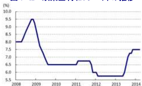
図7 ID 政策金利(BIレート)の推移

13日、インドネシア銀行は定例の金融政策委員会を開催し、政策金利であるB I レートを4会合連続で7.50%に据え置く決定を行った。加えて、翌日物預金ファシリティ金利(F A S B I)及び貸出ファシリティ金利も4会合連続でそれぞれ5.75%、7.50%に据え置かれた。足下のインフレ率は前年同月比+7.75%と依然高水準で推移しているものの、これまでの金融引き締めによって2014年のインフレ率は4.5±1.0%に、2015年は4.0±1.0%の範囲に収まるほか、経常赤字幅も縮小が見込まれるとした。その上で、海外経済については想定していた以上に弱い動きに留まるものの、緩やかな景気回復が見込まれるほか、同国経済についても景気減速は続く一方でバランスの取れた経済成長は続くとし、今年の経済成長率については従来の見方(5.8～6.2%)から5.5～5.9%に見通しを下方修正している。なお、外需の回復に伴う対外収支の改善は国内景気のバランス改善に繋がるほか、通貨ルピア相場の安定をもたらしており、こうした動きもインフレ率の低下を促すとしている。足下では国際金融市場の混乱が一服していることも、同国金融市場の安定に繋がっており、先行きの景気についても比較的安定した成長が見込まれるとしている。