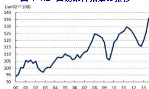
図4 NZ 交易条件指数の推移