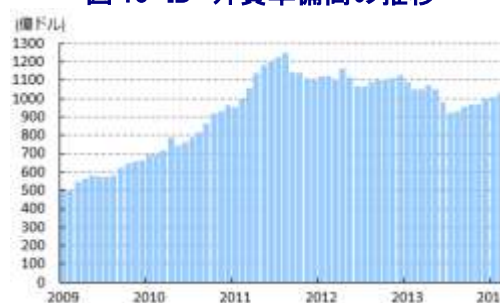
図10 ID 外貨準備高の推移