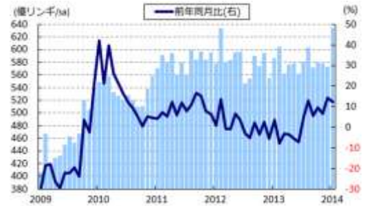
図 26 MY 輸出額の推移