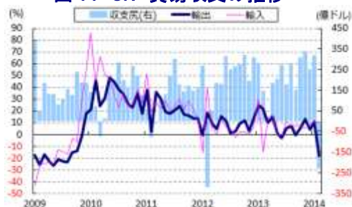
図 14 CN 貿易収支の推移

方、工業用原料である非金属鉱物や鉄鋼関連では依然として高い伸びがみられるほか、鉱業以外では、公共投資の進捗を反映して鉄道輸送関連の投資は大幅な伸びが続いている。なお、公的部門に比べて民間部門の固定資本投資は高い伸びがみられることから、依然として民間企業を中心に設備投資意欲は小さくないと考えられる。ただし、民間部門では資金調達手段として理財商品をはじめとするシャドーバンキングを活用する動きが広がっており、足下ではこれが金融システム不安の引き金になる可能性が指摘されている。共産党・政府が開催した全人代（全国人民代表大会）においては、シャドーバンキングの監督を強化する方針が打ち出されるなど、企業の資金調達のハードルが挙がることで徐々に設備投資意欲に下押し圧力が掛かることが予想される。