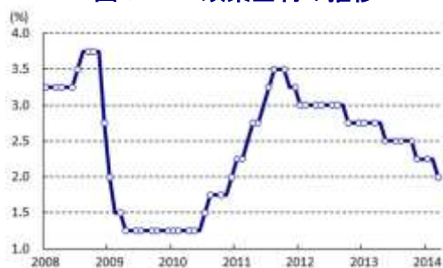
図5 TH 政策金利の推移