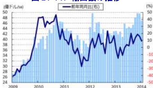
図 24 PH 輸出額の推移

11日に発表された1月の輸出額は前年同月比+9.3%となり、前月（同+15.8%）から減速した。先進国を中心とする世界経済の回復期待を背景に、日米欧などの先進国向けのほか、アジア新興国向けも堅調な推移が見られる一方、月末から中華圏で始まった春節（旧正月）の影響で中国向けが大きく落ち込んだことが足かせになった。なお、2月も中国では輸出財の生産に関連した素材及び部材の需要が低迷していることから、輸出の1割強を中国向けが占めている上、その多くが電子部品関連であることを勘案すれば、当面は厳しい状況が続く可能性は小さくないと予想される。