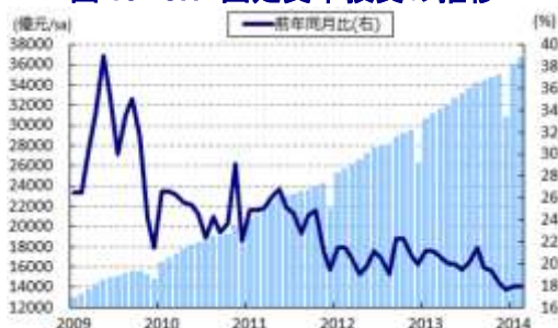
図 18 CN 固定資本投資の推移