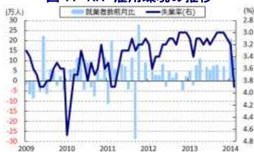
図11 KR 雇用環境の推移

13日、韓国銀行は定例の金融政策委員会を開催し、政策金利を10ヶ月連続で2.50%に据え置く決定を行った。海外経済に対する見方は2月の前回会合からまったく変わっておらず、国内経済についても、内需に弱さがみられる一方、外需の回復に伴い潜在成長率並みの回復がみられるとして、前回会合の見方を踏襲している。雇用についても高齢層やサービス部門の雇用拡大はみられるものの、当面は負の需給ギャップが残り、そのマイナス幅は徐々に縮小していくとの従来の見方を据え置いた。2月のインフレ率は燃料価格の下落などが影響して前年同月比+1.0%に減速したものの、コア物価は同+1.7%とインフレ率を上回る伸びが続いており、同行は先行きのインフレ率について農業生産の改善に伴い比較的低水準での推移が続くものの、インフレ圧力は徐々に高まるとの見方を示している。さらに、低迷が続いた不動産市況も首都ソウル周辺での取引高の底入れに伴い徐々に上昇基調を強めるとしている。また、中国景気の不透明感を背景とする国際金融市場の動揺は様々な形で同国市場に影響を与えているものの、足下では落ち着きを取り戻しており、現行の金融政策を据え置くことにした。先行きのリスク要因として主要国における金融政策の変更やウクライナ情勢を挙げており、この動向に応じては政策調整を行う余地を残していると考えられる。なお、今月末には金仲秀総裁が任期満了を迎えるなか、韓国政府は次期総裁として元同行副総裁で延世大学教授の李柱烈氏を指名している。李次期総裁は中銀の独立性を重視する一方、副総裁就任時は世界金融危機への対応で辣腕を振った経緯があることから、今回の総裁指名に至ったものと考えられる。