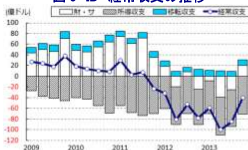
図9 ID 経常収支の推移