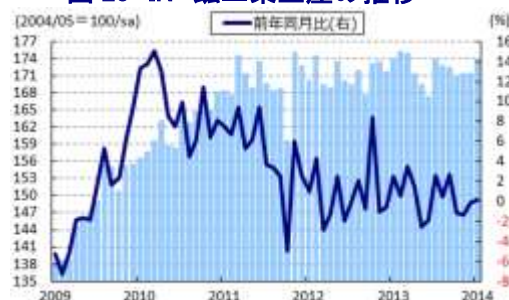
図20 IN 鉱工業生産の推移