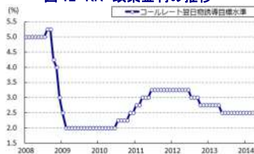
図12 KR 政策金利の推移