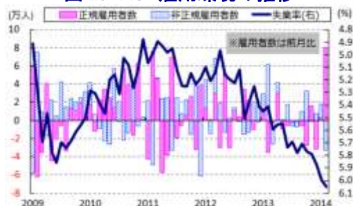
図 23 AU 雇用環境の推移

り、正規雇用を巡る雇用環境に改善の兆候が出ている。なお、就業者数が大幅に拡大しているにも拘らず失業率が横這いで推移している背景には、米国をはじめとする先進国景気の回復に伴い労働者人口が前月比+5.7万人と前月（同+3.5万人）に続いて増加していることが考えられ、労働参加率も64.8%と前月（64.6%）から+0.2p上昇している。地域別では、中国経済の不透明感などを背景に鉱業関連が盛んなウェスタン・オーストラリア州の雇用環境は依然として厳しい状況が続いているが、商都シドニーを擁するニュー・サウス・ウェールズ州などでは底入れの動きもみられ、地域ごとに跛行色が高まる可能性もうかがえる。