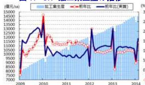
図 17 CN 鉱工業生産の推移