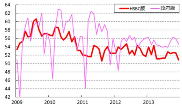
図3 非製造業 (サービス業) PMI の推移