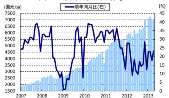
図2 不動産投資の推移