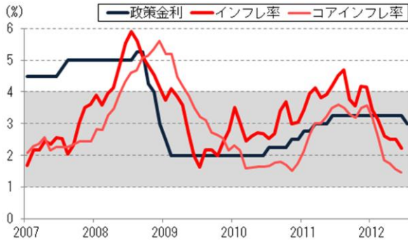
図1 政策金利とインフレ率の推移

外資金に依存する中、欧州問題が再び注目されて金融市場が混乱する可能性は小さくなく、国内の資金需給に影響を与えることも予想される。政府は今月、運転停止中だった古里原発の再稼動を許可する方針を示しており、今夏に大規模計画停電が実施される最悪の事態は免れる見通しだが、依然電力不足は深刻であることから、経済活動の足かせになることも考えられる。こうした状況を鑑みれば、先行きの金融政策については、年末までに1～2回の追加利下げが実施される可能性が高まっていると予想する。