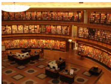
資料2 円形の中央ホール