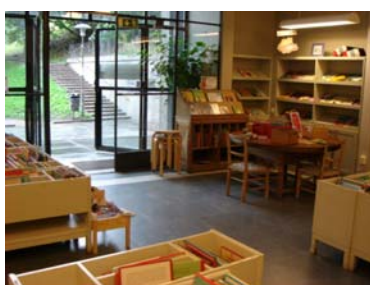
資料4 子どものスペース