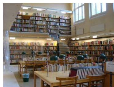
資料3 閲覧・学習スペース