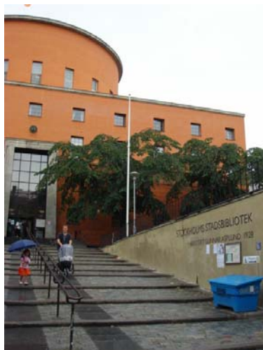
資料1 スtockホルム市立図書館 （外観）