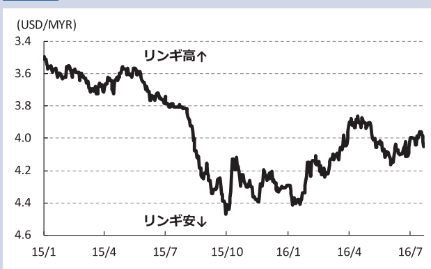
資料1 リング相場（対ドル）の推移

抱えて資金繰りに窮する事態に陥っていた。さらに、金融市場から調達した資金の一部を不正に使用していたことが明らかになり、昨年秋口にかけて金融市場では同社のデフォルト（債務不履行）が財政負担に繋がることを懸念して通貨リングが大きく売られる場面がみられた（その後発表された報告書では、昨年10月末時点におけるリスクエクスポージャーは203億リング（約52億ドル）であったとされる）。