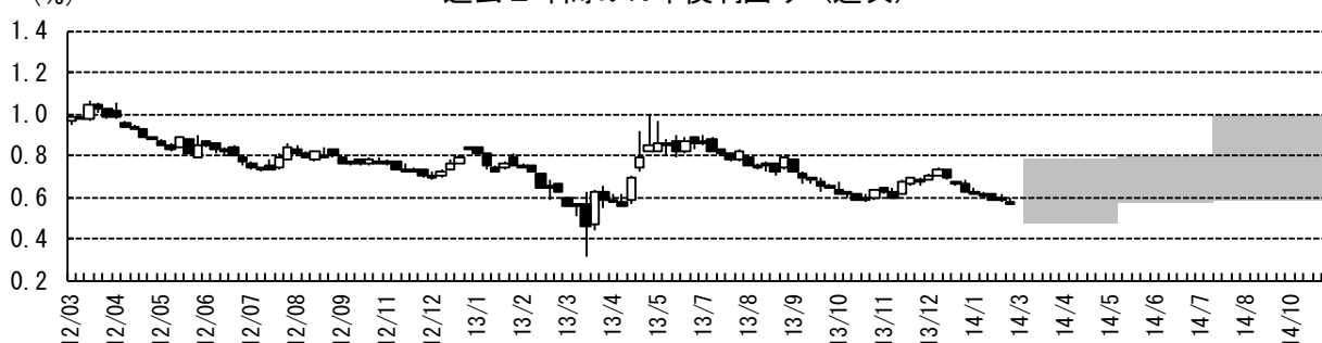
過去2年間の10年債利回り (週次)