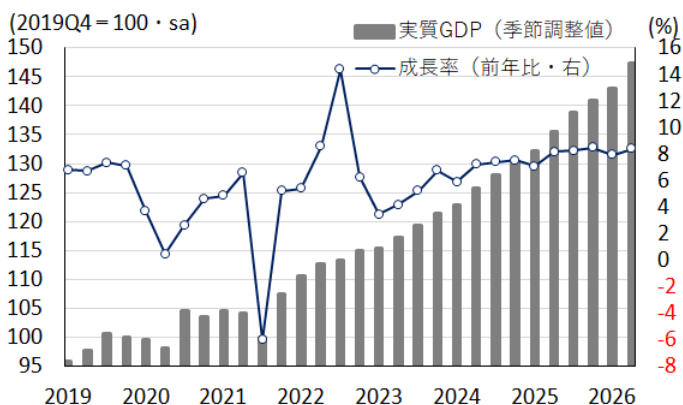
図2 実質GDP(季節調整値)と成長率(前年比)の推移

ベトナム政府は1-3月から新基準によるGDP統計を公表しているものの、断続的なデータとなっており、その連続性などに問題があることに注意する必要がある。さらに、今回は総資本投資の伸びの大幅な加速が成長率を押し上げたものの、その内訳は示されていない。仮に在庫投資が拡大していれば、数字と景気実態との乖離が広がっている可能性がある。なお、前述したように、共産党・政府は2026年の経済成長率目標を10%以上としたものの、年前半の経済成長率は+8.26%にとどまっている。仮にこの目標を実現するためには、年後半の経済成長率を+10.6%以上に引き上げる必要があると試算される。足元では原油高の動きは一服しているものの、中東情勢は依然として予断を許さない状況が続いており、一段の景気加速を見込むことは難しい。このため、2026年の経済成長率目標の実現のハードルは極めて高いと考えられる。