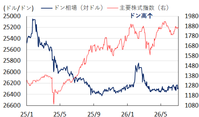
図4 ドン相場(対ドル)と主要株価指数の推移

る。当面の実体経済については、国内・外双方に不透明要因が山積しており、過度な期待を抱くことは禁物であるうえ、政府が目標実現に固執することへの警戒感が残るものの、身の丈に合った目標設定とその実現に向けたロードマップを構築できるかが注目される。