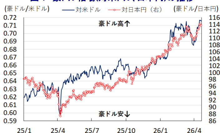
図1 豪ドル相場(対米ドル、日本円)の推移

こうしたなか、金融市場ではオーストラリアに注目が集まっている。同国は、世界の石炭輸出量の4分の1、LNG（液化天然ガス）輸出量の2割を占めるなどエネルギー資源が豊富である。さらに、世界の小麦輸出量の15%、大麦輸出量の約2割を占める穀物輸出国という特徴も有する。こうした事情も、資源価格や穀物