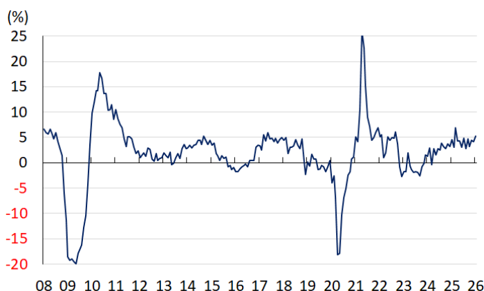
図1 世界貿易量(前年比)の推移

中東情勢が緊迫化する直前の2月末時点における主要新興国の外貨準備高をみると、IMF(国際通貨基金)が金融市場の動揺への耐性の有無を示すARA(適正水準評価)に照らし、「適正水準(100~150%)」に満たない国が散見される。その後の金融市場においては、前述したように多くの新興国で資金流出の動きが活発化していることを勘案すれば、外貨準備高がさらに減少している可