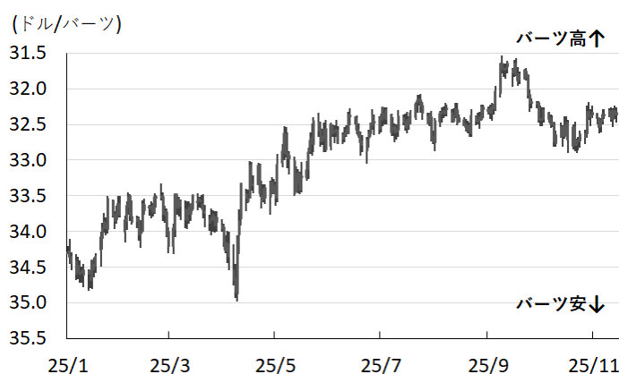
図3 バート相場(対ドル)の推移