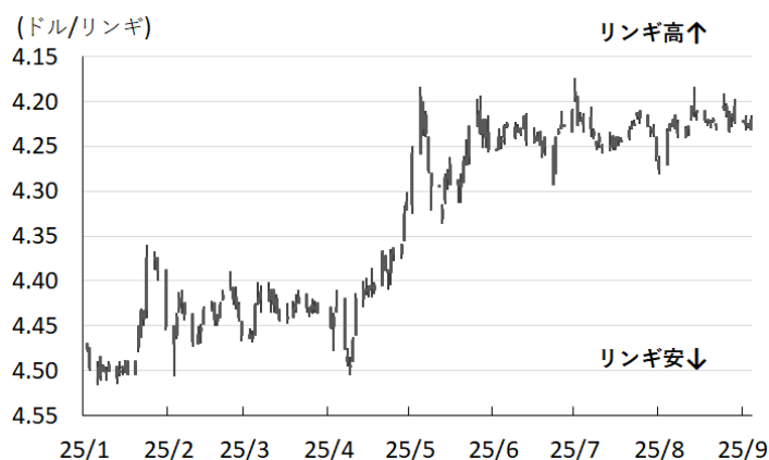
図2 リング相場(対ドル)の推移

て、中銀は現行のスタンスを長期間にわたって維持する可能性が見込まれるほか、米ドル安が意識されやすい環境が続けばリング相場は底堅い動きをみせることも予想される。