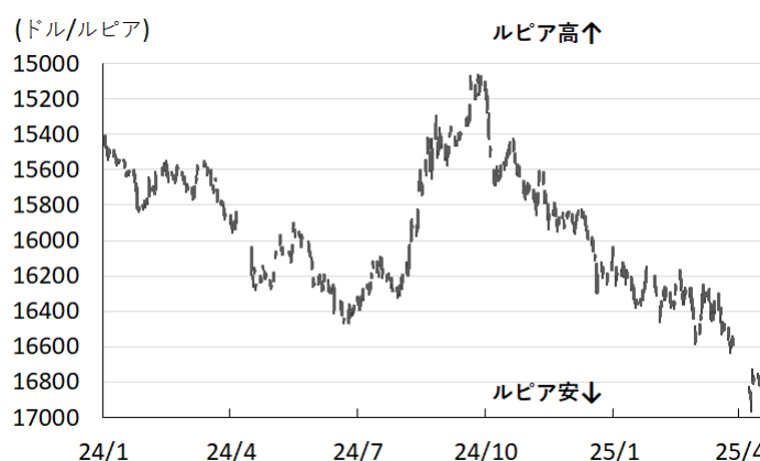
図3 ルピア相場(対ドル)の推移