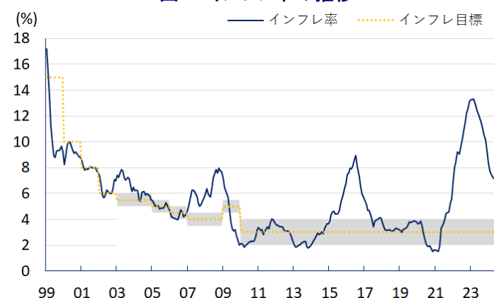
図1 インフレ率の推移

南米コロンビアの中銀は、30日に開催した定例の金融政策委員会において、政策金利を50bp引き下げて10.75%とする決定を行った。ここ数年のコロンビアでは、コロナ禍一巡による経済活動の正常化や商品高に加え、国際金融市場における米ドル高を受けた通貨ペソ安による輸入インフレ、歴史的な大干ばつに伴う電源構成の6割以上を占める水力発電の稼働低迷なども重なり、インフレは大きく上振れした。よって、中銀は物価と為替の安定を目的に累計1150bpもの断続利上げに動き、昨年初めにインフレは一時24年ぶりの水準となるも、その後は商品高の一巡も重なり頭打ちに転じてきた。なお、昨年来の中南米ではインフレ鈍化を理由に利下げに舵を切る『利下げドミノ』とも呼べる動きが広がりを見せてきたものの、コロンビアではインフレ率が中銀目標を上回る推移が続いたため、中銀は慎重な姿勢をみせてきた。他方、金利高と物価高の共存長期化に加え、主力の輸出財である原油価格も世界経済を巡る不透明感を理由に上値の重い展開が続いており、昨年の経済成長率は+0.6%に留まるなど他の新興国と比較して見劣りする展開をみせてきた。したがって、インフレ率は中銀目標を大幅に上回る状況ながら、中銀は昨年12月に3年3ヶ月ぶりの利下げに舵を切り