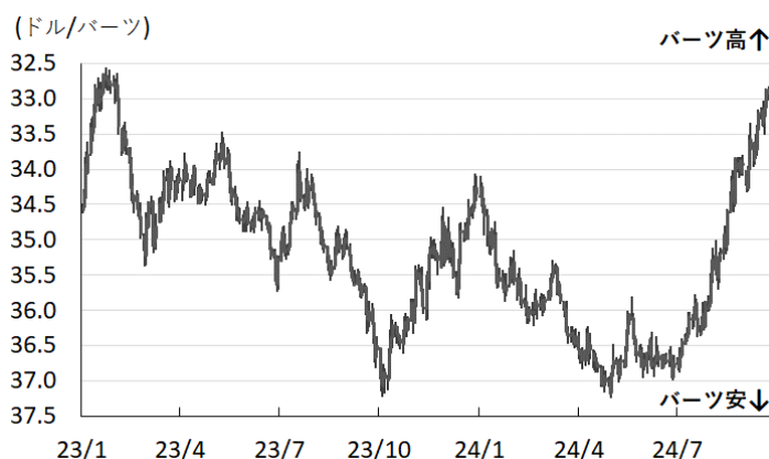
図2 パーツ相場(対ドル)の推移

本資料は情報提供を目的として作成されたものであり、投資勧誘を目的としたものではありません。作成時点で、第一生命経済研究所経済調査部が信ずるに足ると判断した情報に基づき作成していますが、その正確性、完全性に対する責任は負いません。見直しは予告なく変更されることがあります。また、記載された内容は、第一生命保険ないしはその関連会社の投資方針と常に整合的であるとは限りません。