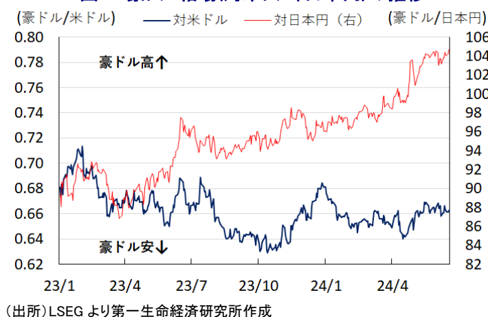
図3 豪ドル相場(対米ドル、日本円)の推移