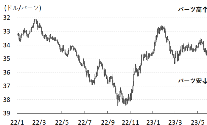
図 2 パーツ相場(対ドル)の推移

同国経済にとっては追い風が吹く動きがみられる。この結果、今年 1-3 月の実質 GDP 成長率は前期比年率+7.82%と 2 四半期ぶりのプラス成長に転じるとともに、中期的な基調も伸びが加速するなど、足下の景気は底入れしている様子がうかがえる（注 2）。さらに、ゼロコロナ終了を受けた中国景気の底入れや中国人観光客数の回復の動きも追い風に、ここ数年は赤字基調で推移した経常収支は足下で黒字基調に転じるなど、経済のファンダメンタルズを巡る状況も変化している。こうした環境変化も影響して、足下のパーツ相場は底堅い動きが続くなど輸入インフレ懸念も大きく後退している。このように物価を取り巻く状況は大きく変化しているものの、中銀は 31 日に開催した定例会合において 6 会合連続となる 25bp の利上げを決定しており、これに伴い政策金利は 2.00%と 8 年強ぶりの水準となる。会合後に公表した声明文では、同国経済について「 観光関連と家計消費をけん引役に回復が続く 」とした上で経済成長率見通しを「 今年は+3.6%、来年は+3.8% 」と 3 月の前回会合時点から据え置く一方、「財政政策に拠る上振れと外部環境に拠る下振れを警戒する必要がある」との見方を示した。一方、物価動向について「 緩やかなペースでの鈍化が見込まれる 」としてインフレ見通しを「 今年は+2.5%、来年は+2.4% 」と今年を 3 月の前回会合時点（+2.9%）から下方修正する一方、コアインフレについて「 過去と比較して高水準で推移しており、今後は需給両面からの上昇圧力に留意する必要がある 」との認識を示した。また、パーツ相場について「 米 F R B（連邦準備制度理事会）による政策運営、人民元安、国内政治を巡る不確実性などが影響する 」との見方を示した上で、「 金融市場を取り巻く状況を注視する必要がある 」として安定を重視する姿勢を示している。先行きの政策運営については「 物価安定と潜在力に沿う持続可能な景気拡大、金融安定を目指す 」とした上で「 着実な景気拡大が期待されるものの、