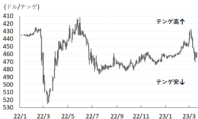
図 2 テンゲ相場(対ドル)の推移

上値が抑えられるなど、神経質な展開が続いている。トカエフ氏による一連の政治改革に道筋が付いたなか、今後は上述のように地政学面でも重要な同国の行方については外交、及び経済の動きにこれまで以上に注意を払う必要性が高まっていると判断出来る。