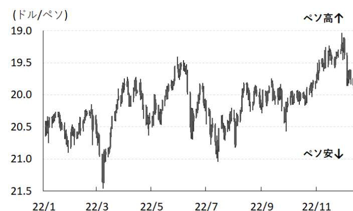
図2 ペソ相場(対ドル)の推移