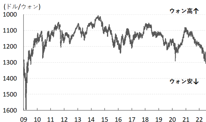
図1 ウォン相場(対ドル)の推移

方、中銀による断続的な利上げ実施を受けて上昇が続いた不動産市況は下落に転じており、首都ソウルも頭打ちするなど、その効果が徐々に現れる兆しもうかがえる。こうしたなか、中銀は25日に開催した定例会合において4会合連続の利上げを実施する一方、利上げ幅を25bpに縮小して政策金利を2.50%とする決定を行った。また、中小企業向けの資金支援を目的とする流動性供給策（Bank Intermediated Lending Support Facility）の適用金利を前回会合に続き25bp引き上げる（1.00%→1.25%）一方、コロナ禍対応を目的とする中小企業向け貸付の適用金利は0.25%に据え置いている。会合後に公表された声明文では、世界経済について「 ウクライナ情勢の悪化や主要国における利上げなどを受けて下振れリスクが高まっている 」ほか、同国経済について「 主要国の景気減速による輸出鈍化により下振れリスクが高まっている 」との認識を示し、経済成長率見通しを「 今年は+2.6%、来年は+2.1% 」と5月時点の見通し（今年は+2.7%、来年は+2.4%）から下方修正した。一方、物価動向について「 原油価格の