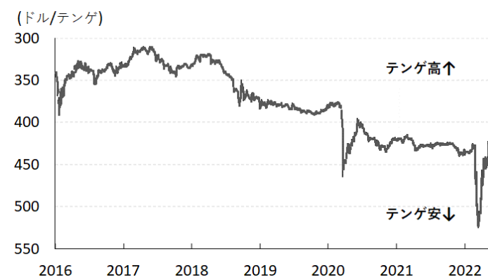
図2 テンゲ相場(対ドル)の推移

その後の事態収束や国際原油価格の上振れも追い風に足下ではデモ前の水準を取り戻している。しかし、ここ数年のテンゲ相場は調整局面が続くなどインフレ圧力を招きやすい状況は変わっておらず、主力産業である原油関連も自然災害に伴うパイプラインの損傷を理由に輸出が低迷しており、主要産油国であるOPECプラスによる生産目標を達成出来ない状況が続くなどコロナ