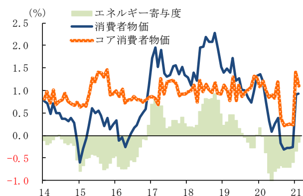
■ユーロ圏: 消費者物価（前年比）