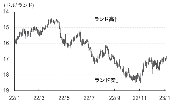
資料2 ランド相場(対ドル)の推移