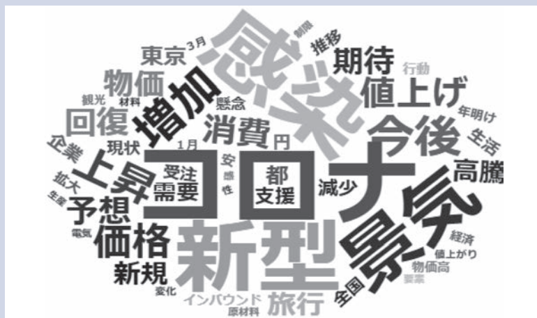
景気判断理由集(先行き)のワードクラウド

(注)ワードクラウドはテキストを単語単位に分解したうえで、出現頻度を文字の大きさで表現したものを、助詞や記号など、景気に関連のない語と判断したものは除いている。